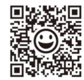
やじろべえページ